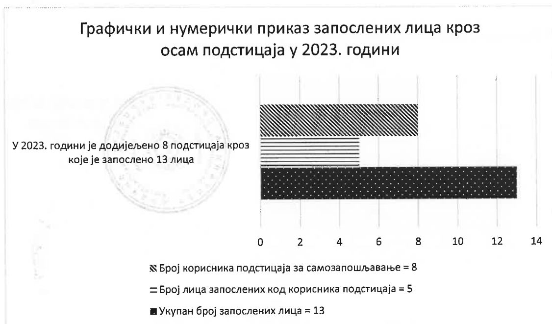
2.2.1 Графички приказ запослених лица кроз осам додијељених подстицаја у 2023. години

Поред тога, један од индикатора мјерљивости успјешности овог програма samozapošljavanja је број новостворених радних мјеста. Главни позитивни ефекти samozapošljavanja младих огледају се у чињеници да је поред осам корисника подстицаја у 2023. години, у њиховим предузетничким радњама запослено још пет лица. То је показатељ да провођењем овог програма, није у питању просто samozapošljavanje, него је то истовремено и прилика за отварање нових радних мјеста. Кроз осам подстицаја запослено је укупно 13 лица.