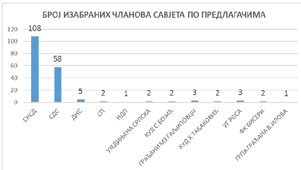
Графикон бр. 3.

Свим заинтересованим грађанима, медијима и предлагачима кандидатских листи резултати избора били су доступни на веб страници Општине Прњавор, како прелиминарни резултати за све мјесне заједнице, тако и коначни овјерени резултати.